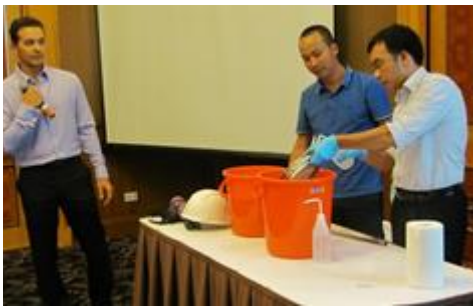
Hands on demonstrations of standard operating procedures for dioxin soil and sediment sampling

USAID held the first of a four-part training program designed for Government of Vietnam stakeholders and counterparts on key aspects of conducting an environmental assessment. Part One was held over a three-day period and was attended by 30 representatives from the Ministry of Defense - Academy of Military Science and Technology, Air Defense Air Force Command Chemical Command, Vietnam-Russia Tropical Center; Dong Nai Department of Natural Resources and Environment; Danang Department of Natural Resources and Environment; Center for Environmental Monitoring under the Ministry of Environment and Natural Resources/Vietnam Environment Administration; and Office 33. The training covered aspects of sampling including standard operating procedures, methodology, and planning. Training activities included classroom lectures, hands-on demonstrations, and practical application through case study exercises.