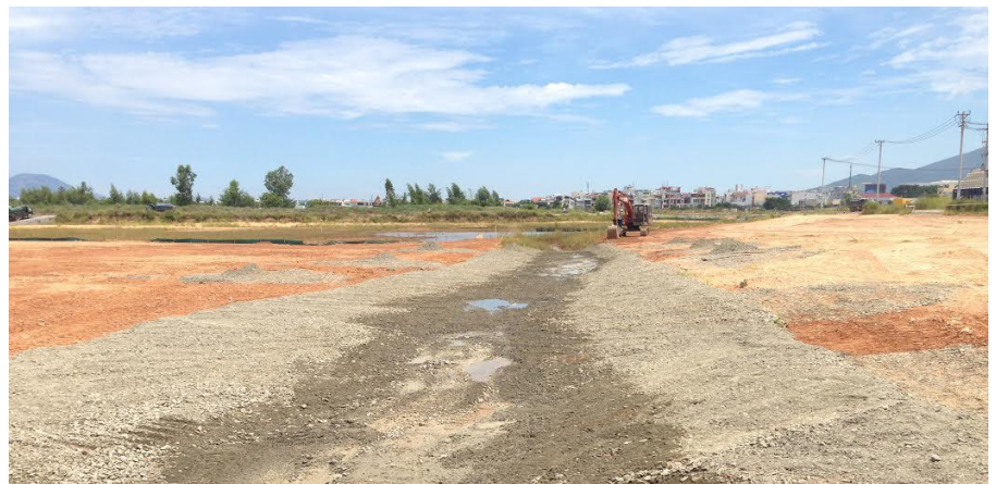
Preparing the site for the rainy season with erosion control measures

USAID contractors completed the the majority of Phase 2 excavation activities in Sen Lake and the surrounding wetlands at the northern end of the Project site, ahead of the 2015 schedule. The site was secured for the upcoming rainy season by installing erosion control measures and covering contaminated areas with clean crushed stone and backfill to prevent erosion and prevent the migration of any contaminated material offsite.