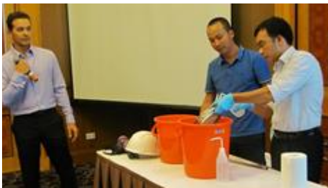
Trình diễn thực hành về quy trình hoạt động chuẩn cho việc lấy mẫu đất và bùn nhiễm dioxin

Các hoạt động đào tạo gồm bài giảng trong lớp, trình diễn thực hành và ứng dụng thực tiễn thông qua các bài tập nghiên cứu tình huống.