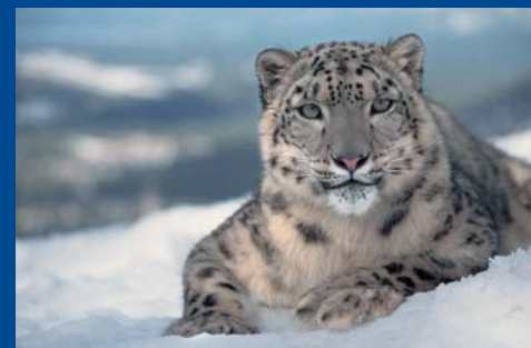
Сырткы беттеги фото:

Кургак учукка каршы күрөштүн Дүйнөлүк күнүнүн урматында USAID Саламаттык сактоо министрлигин иш-чараларда колдоо үчүн эл аралык жана жергиликтүү өнөктөр менен бирикти, ал иш-чаралар кургак учук маселесинде маалымдарлыкты жогорулатуу жана жакшылап түшүнүүгө көмөк көрсөтөт. Ага мелдештерди жана бий конкурстарын өткөрүү кирет.