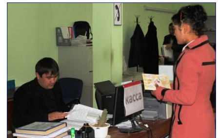
ЮРКЛИНИКИ ПОМОГАЮТ ПОЛУЧИТЬ ДОКУМЕНТЫ