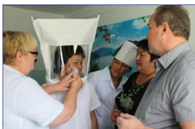
НОВЫЕ МЕРЫ ИНФЕКЦИОННОГО КОНТРОЛЯ В БОЛЬНИЦАХ