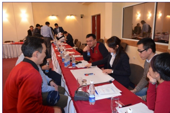
Участники встречи обсуждают координацию работы между государственными органами.

Участники рекомендовали принять единый подход к планированию законотворческой деятельности и согласились пересмотреть свое расписание работы, отталкиваясь от расписания Жогорку Кенеша. Другими рекомендациями стали создание официальной базы данных законопроектов на основе систем Токтом и Параграф и разработка стратегического плана законотворческой деятельности, основанного на социальном и экономическом анализе. В обязанность Жогорку Кенеш входит создание комитета для наблюдения за исполнением плана.