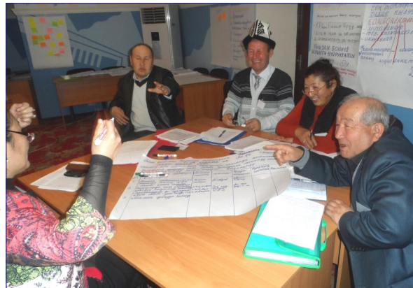
Директора школ обсуждают командное задание во время тренинга.

С января по март Ошский институт образования в партнерстве с программой "Образование" ОФ "Программа