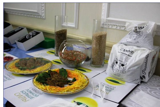
Пищевая добавка USAID обогащает блюда местной кухни необходимыми минералами и витаминами.

Больше о проекте можно узнать по ссылке .