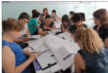
НОВЫЙ ПОДХОД К ПРЕПОДАВАНИЮ ЧТЕНИЯ