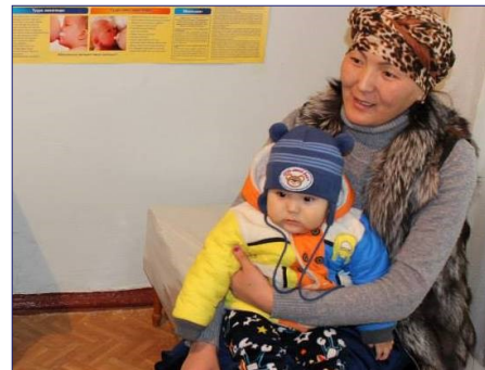
Мама с ребенком во время консультации по питанию.

Больше о проекте можно узнать по ссылке .