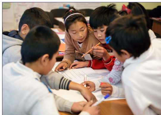
Школьники решают проблему во время занятия по программе Паспорт к успеху.

Чтобы программа «Паспорт к успеху» продолжилась после окончания проекта Jasa.kg, один из партнеров проекта - организация Институт Детства - добилась ее включения в официальный список факультативов. Более того, стандартный четырехдневный тренинг, обучающий учителей программе «Паспорт к успеху», был включен в систему повышения квалификации Кыргызской академии образования. В марте-апреле Институт Детства совместно с Академией провел первый обучающий курс для 43 учителей из 29 интернатов со всех областей. Институт Детства продолжит работу с Министерством образования для того, чтобы «Паспорт к успеху» стал постоянным компонентом школьной программы в республике.