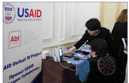
Участники конференции проверяют работу нового оборудования.

на которой обсудили результаты информационной кампании по борьбе с туберкулезом и отметили работу медицинских учреждений и сотрудников, внесших особый вклад в борьбу с туберкулезом. Лучшие специалисты получили награды, а лучшие медицинские учреждения - медицинский инвентарь стоимостью $ 200 000 от проекта USAID «Победим туберкулез», в том числе медицинские маски, шприцы, аппараты для измерения артериального давления, напольные весы, защитную одежду для сотрудников лабораторий, стетоскопы, и другой необходимый инвентарь.