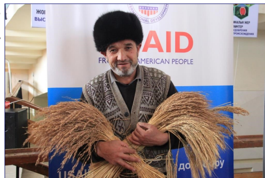
Участник форума, представляющий свою продукцию.

Больше о проекте можно узнать по ссылке .