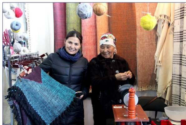
Участница проекта демонстрирует свою продукцию на выставке «Легпром».

Больше о проекте можно узнать по ССЫЛКЕ .