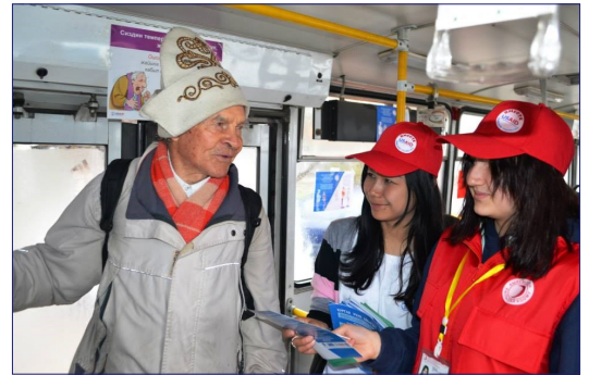
Первого пассажира информационного троллейбуса встречают волонтеры USAID/Красного полумесяца.

Весь март USAID проводил информационную кампанию, посвященную Международному дню борьбы с туберкулезом. По всей республике в рамках кампании прошло свыше 20 информационных мероприятий. 24 марта—в сам День борьбы с туберкулезом - бишкекчане могли бесплатно проехать на информационном троллейбусе, в котором были размещены постеры с информацией о профилактике и лечении