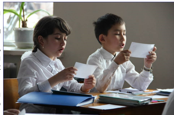
Ученики третьего класса отрабатывают навыки чтения во время открытого урока для районных учителей.