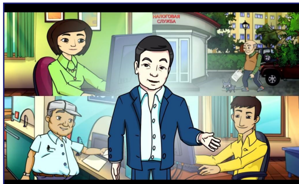
Ключевым компонентом кампании по ЕНД стали телевизионные социальные ролики

Больше о проекте можно узнать по ССЫЛКЕ .