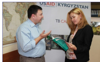
АМБУЛАТОРНОЕ ЛЕЧЕНИЕ ТБ- ЭФФЕКТИВНЫЙ СПОСОБ