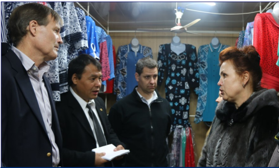
Встреча с предпринимателями на самом крупном оптовом рынке страны - Дордое.

4 апреля Стиверс посетил новое отделение налоговой службы республики на рынке Дордой, открытое при помощи USAID и оказывающее услуги свыше 7000 предпринимателей.