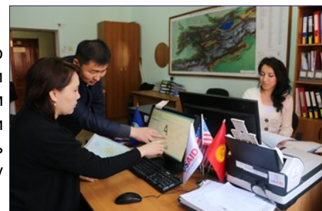
Сотрудники Агентства изучают новое программное обеспечение.

Больше о проектах можно узнать по этой и этой ссылкам.